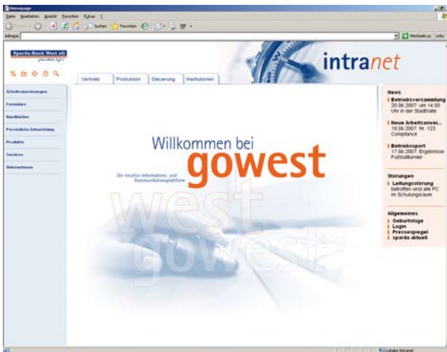
Willkommen bei gowest - Intranet der Sparda-Bank West